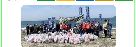
豊橋地区「亀の子隊」西の浜 クリーンアップ活動

SUSTAINABLE DEVELOPMENT GOALS 3 30%削減 7 気候変動 14 海洋資源 12 持続可能な消費と生産 15 陸域生態系