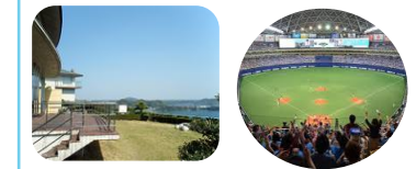
トヨタ紡織 三ヶ日保養所 野球観戦チケットを抽選で提供