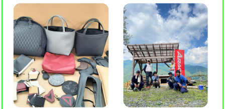
SDGsの活動として工場近隣の高校に端材を提供