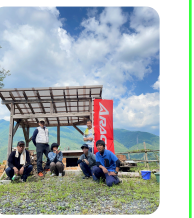
「みらいの森づくり」岐阜県加子母での森林整備活動